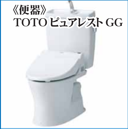
《便器》 TOTO ピュアレスト GG