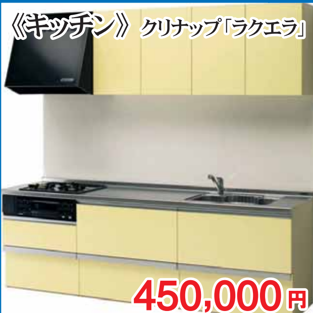
《キッチン》 クリナップ「ラクエラ」