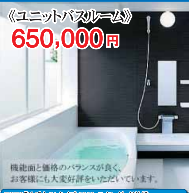
《ユニットバスルーム》

【仕様】I型間口 2550、スタンダードタイプ、加熱機器：ガス 【工事】解体工事、組立工事、設備工事